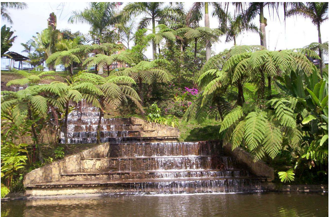
Parque de la Vida. Armenia. 2.008