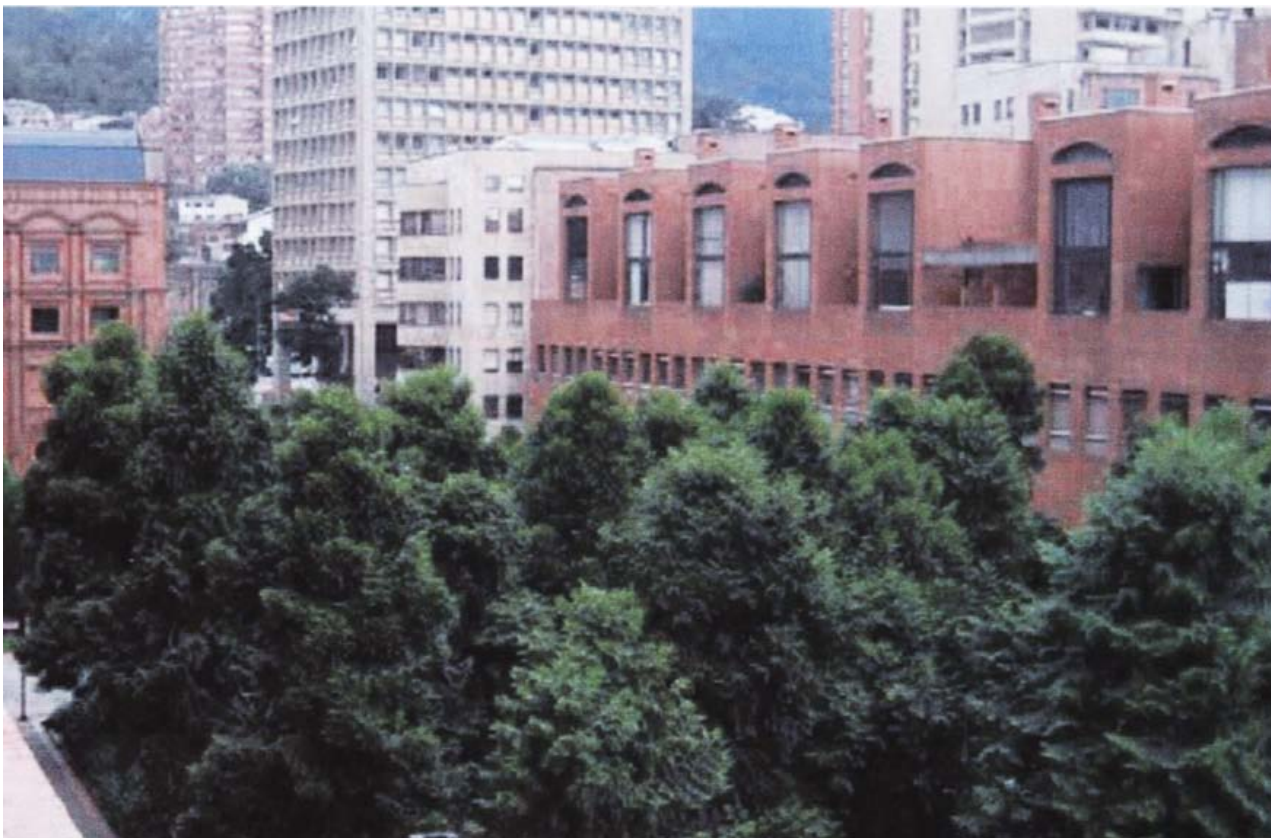
Parque Central Bavaria. Bogotá. 2.005