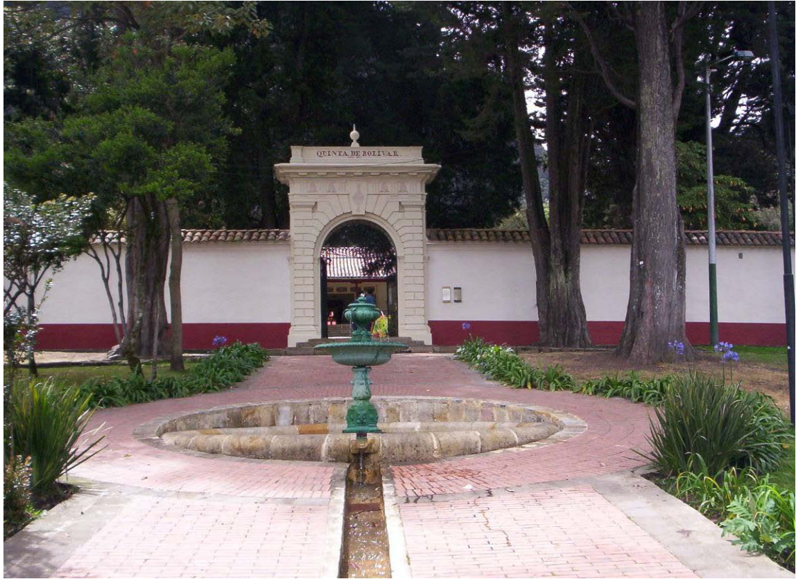
Quinta de Bolívar Monserrate. Bogotá. 2.008