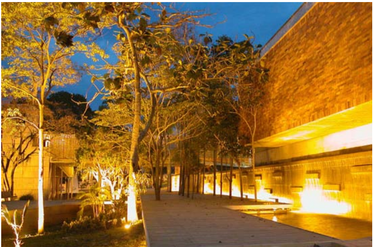
Parque del Agua. Bucaramanga. 2.007