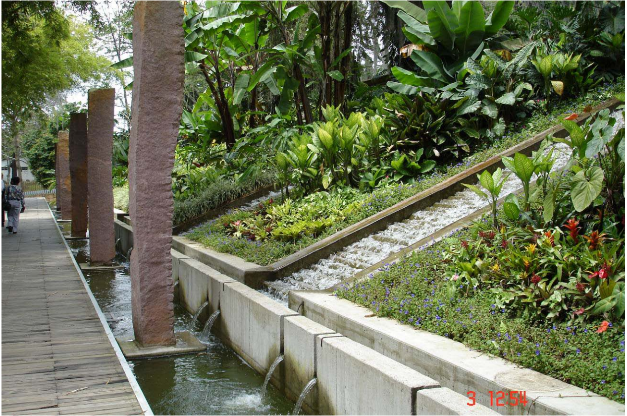
Parque del Agua. Bucaramanga. 2.007