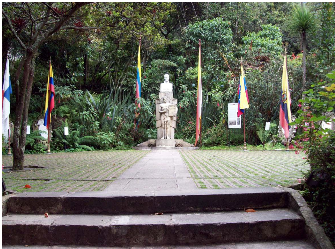
Quinta de Bolívar Monserrate. Bogotá. 2.008