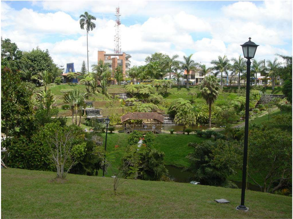
Parque de la Vida. Armenia. 2.008