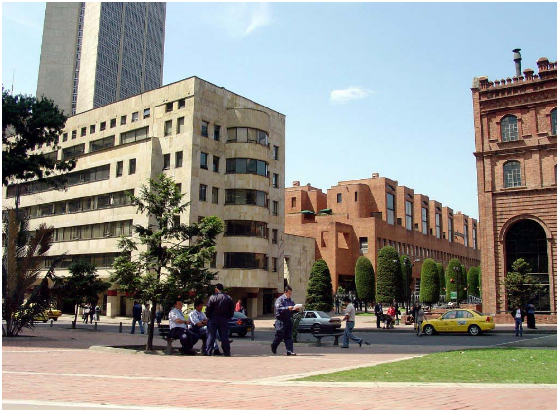
Parque Central Bavaria. Bogotá. 2.005