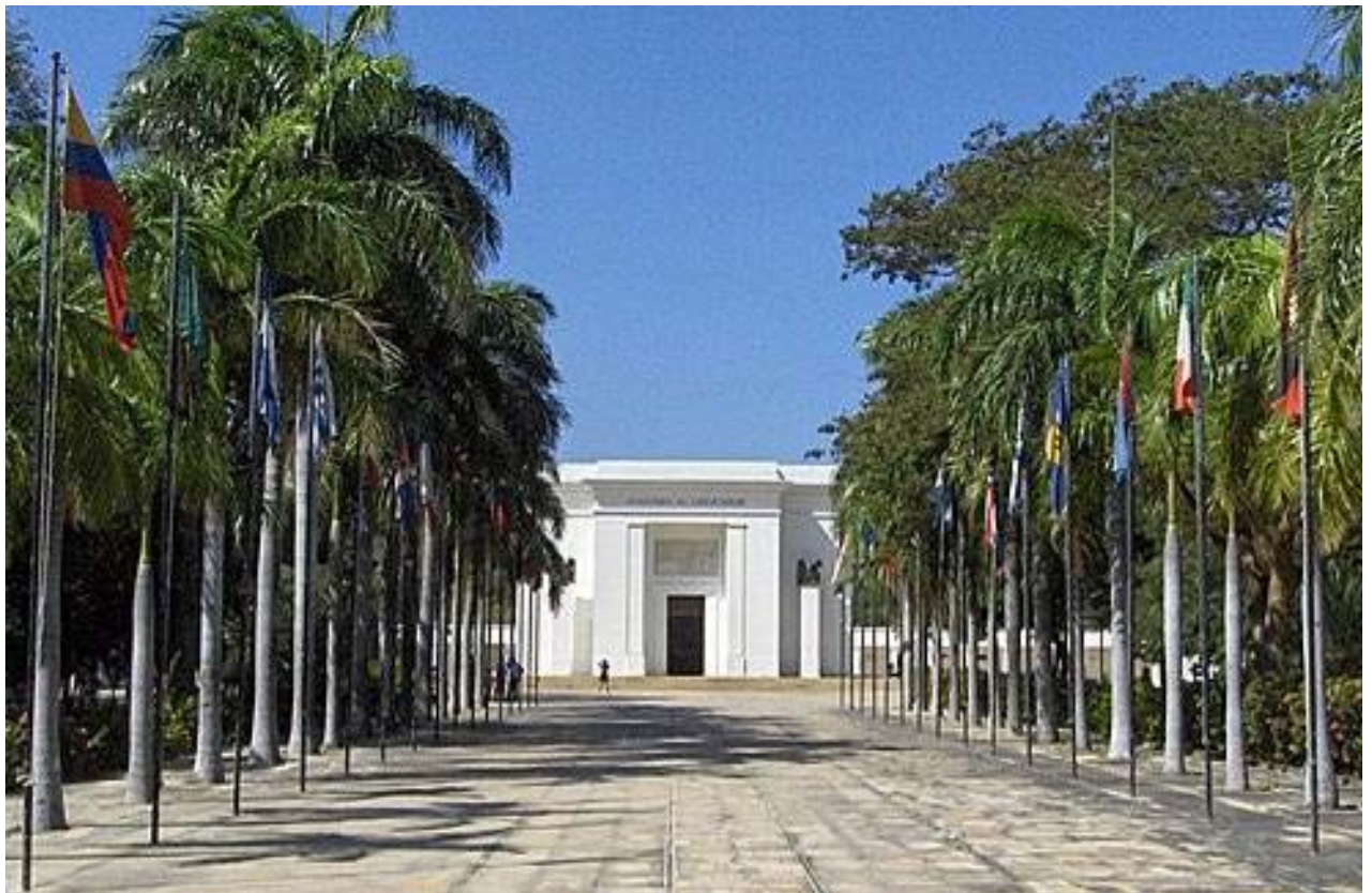
Quinta de San Pedro Alejandrino. Santa Marta. 2.007